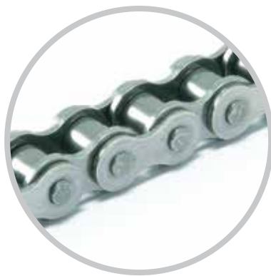
Lanțuri de inox