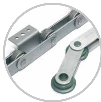
Lanțuri pentru benzi transportoare