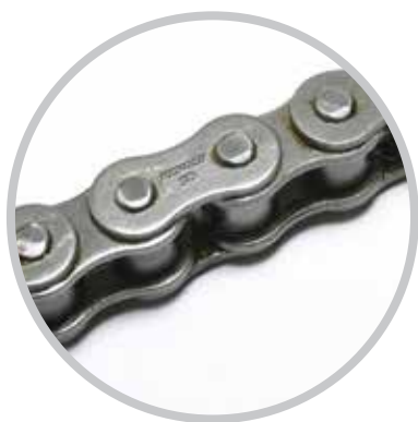
Lanțuri cu role