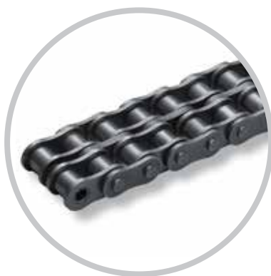
Lanțuri pe mai multe rânduri